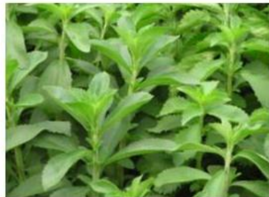
Stevia rebaudiana Bertoni

食品添加物公定書には「ステビア抽出物」として、また、JECFA Monographs には「Steviol Glycosides」(ステビオール配糖体)として記載されています。