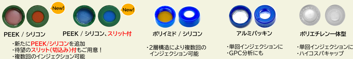
PEEK / シリコン