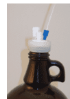
廃液ボトル用 溶媒リザーバー用