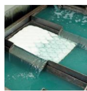
スキミングパッド