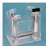
①カバーを外します。