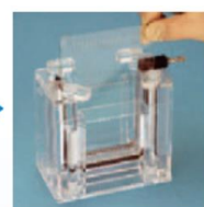
③バッファーを捨てずにゲルを取り出します。