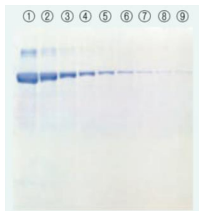
通常法 (洗浄～脱色：約2時間)