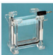
③ゲルのセット完了！