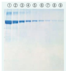
電子レンジ法 (洗浄～脱色：約20分)

サンプル：BSA サンプル量：①Totalタンパク質量として5μg ②～⑨ ①の2倍希釈系列