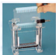
①ゲルを差し込みます。