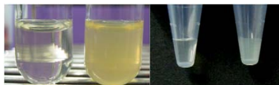
正常検体 乳ビ検体 1000 ホルマジン濁度 正常検体 乳ビ検体 1000 ホルマジン濁度